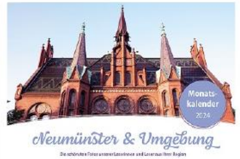
Die schönsten Fotos unserer Landschaften und Lebenshier Region

Uhr bestellt werden. In der Geschäftsstelle des Holsteinischen Couriers am Kuhberg gibt es die Kalender montags bis donnerstags von 9 bis 14 Uhr zu erwerben.