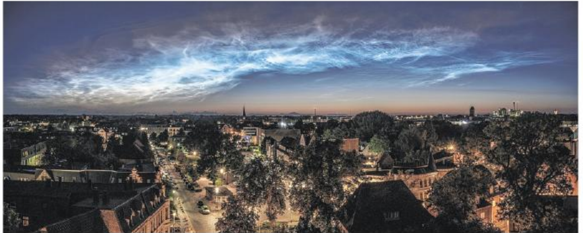
Ein besonders stimmungsvolles Bild findet sich zum Beispiel den Neumünster-Kalender 2024.

Frei nach dem Motto „die Schönheit Schleswig-Holsteins sowie einiger Kreisgebiete und Städte im Fokus festzuhalten“, sind sieben Kalender entstanden, die einen besonderen Blick auf unseren Norden werfen. Es gibt Varianten mit Bildern aus dem gesamten Schleswig-Holstein beziehungsweise aus dem Kreis Pinneberg, aus Nordfriesland, aus der Schleieregion oder aus Flensburg, Itzehoe und Neumünster.